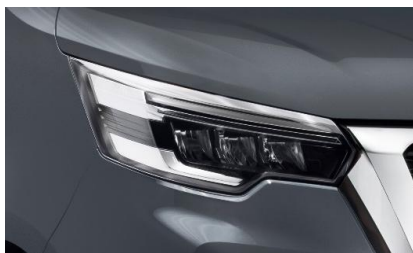
ciemnoszary – KPW/KQR