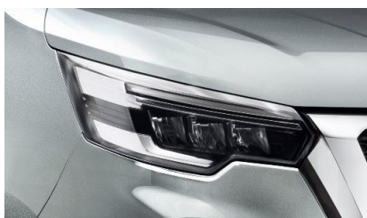
szary Highland – KQA