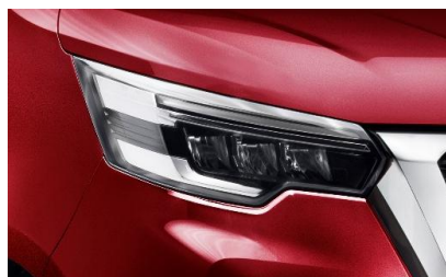
czerwony Carmin – NPF