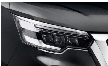
czarny – D68