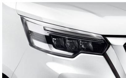
biały – 369/389