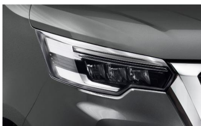
szary – KNA