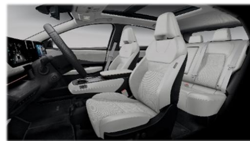
Kremowa [K] (zamsz syntetyczny perforowany + częściowo skóra ekologiczna***)