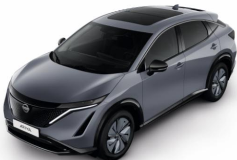
Szary ceramiczny [KBY]

Lakier metalizowany / połowy (jednokolorowe nadwozie) – BEZ DOPŁATY