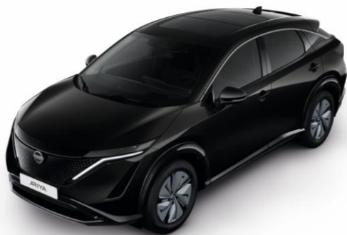
Czarny połowy [GAT]