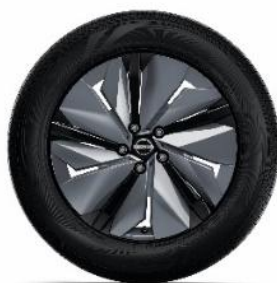
19" felgi ze stopu metali lekkich z nakładkami aerodynamicznymi