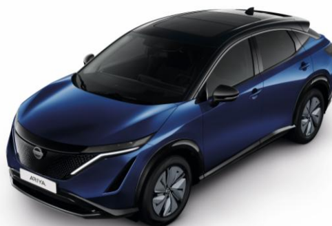
Niebieski połowy + czarny dach i lusterka [XGU]