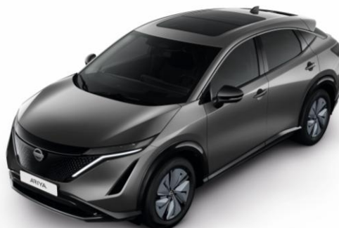
Szary metalizowany [KAD]