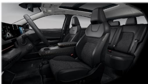
Czarna [G] (zamsz syntetyczny perforowany + częściowo skóra ekologiczna***)