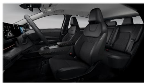
Czarna [G] (materiał + częściowo skóra ekologiczna**) – opcja z Pakietem KOMFORT