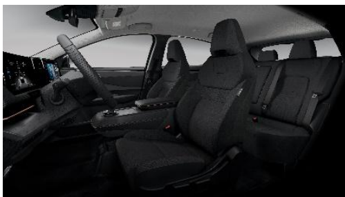
Czarna [G] (materiałowa)