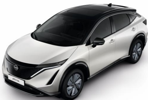
Biały połowy + czarny dach i lusterka [XGA]

Lakier metalizowany / połowy + dach i lusterka w kolorze czarnym – dopłata: 5 000 zł