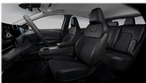
Czarna [G] (materiał + częściowo skóra ekologiczna***)