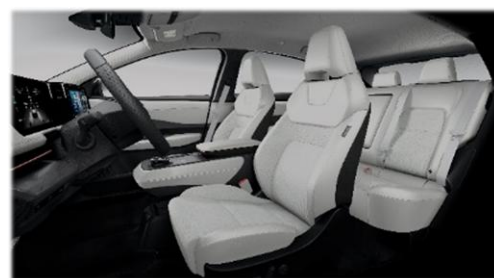
Kremowa [K] (materiał + częściowo skóra ekologiczna***)