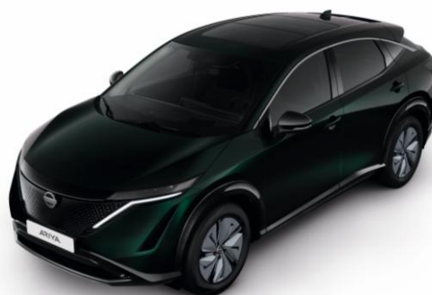
Zielony połowy AURORA [DAP]

Lakier metalizowany / połowy + dach i lusterka w kolorze czarnym – dopłata: 5 000 zł