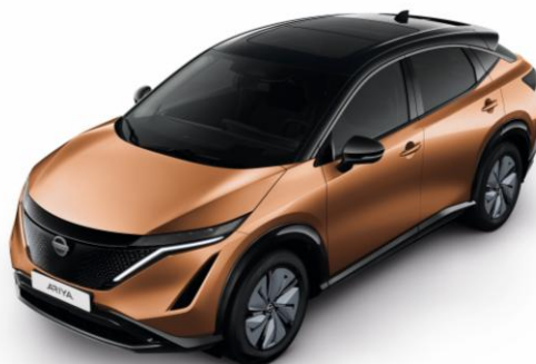
Miedzian Akatsuki + czarny dach i lusterka [XGJ]