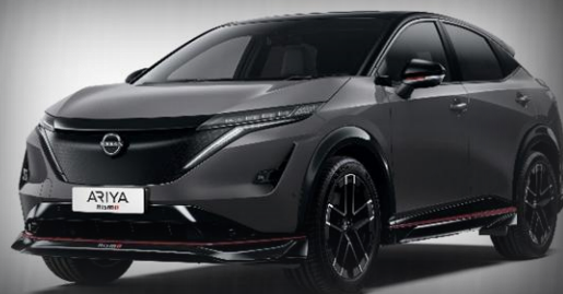
Szary metalizowany [KAD]