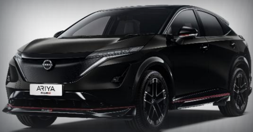
Czarny perłowy [GAT]