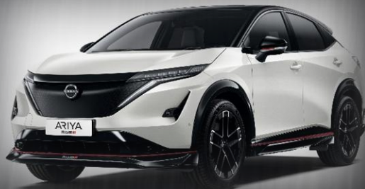
Biały perłowy + czarny dach [XGA]