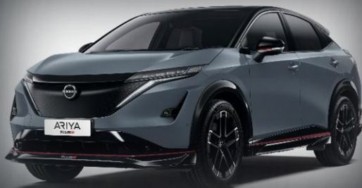
Szary STEALTH + czarny dach [YAZ]